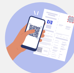
Lecture de pass sur papier