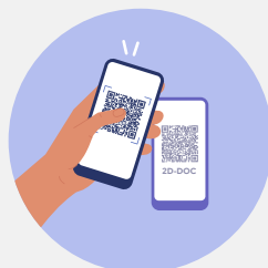
Lecture de pass dans TousAntiCovid Carnet